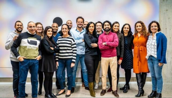
ABN AMRO. Winnaar Award Diversiteit in Bedrijf 2020 in de categorie 'grote bedrijven'.