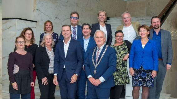
Ondertekenaars tijdens de Charterbijeenkomst (september 2019) bij de Gemeente Hilversum