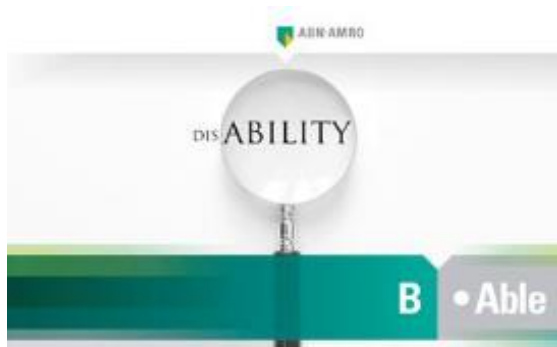
Het netwerk B.Able focust binnen ABN AMRO op de mogelijkheden van medewerkers met een arbeidsbeperking.

De werkgever kan de netwerken op strategische wijze benutten door een beroep te doen op hun specifieke kennis en kunde. Zo vragen sommige werkgevers hun om gericht onderzoek te verrichten naar klanten of cliënten die het bedrijf wenst te bereiken.