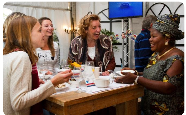
Foto gemaakt tijdens een Integratiediner.